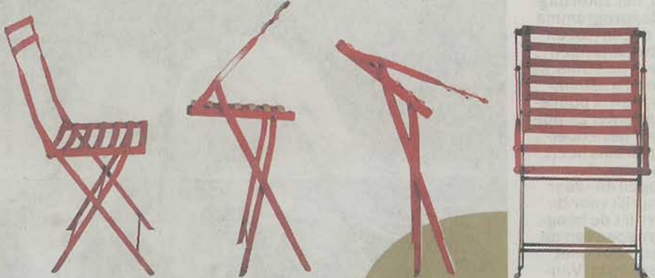
Rode stalen terrasstoel.